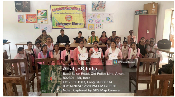
Arrah, BR, India Babu Bazar Road, Old Police Line, Arrah, 802301, BR, India Lat 25.561587, Long 84.666374 03/16/2024 12:20 PM GMT+05:30